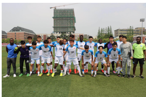
校足男子足球队合照

气氛，吸引众多的足球爱好者，也让更多的学生融入到足球运动项目中，在提升学生技术水平的同时，培养学生顽强的意志力、坚韧不拔、果敢勇猛、团结协作的精神。另外，积极参加各级赛事，比如：参加每一届方松街道运动会足球比赛、园区足球联赛、上海市阳光体育大联赛、上海市校园足球联赛、上海市高校足球联盟杯赛等，通过从校内走向校外，大大促进我校足球项目的发展。在高水平运动队建设思想引领下，我校积极推进足球高水平运动队的建设，不断加强运动队管理，努力改善教练员队伍结构，逐步完善条件保障，积极承办高水平体育赛事，积极开展群众体育工作，取得了明显的成效。