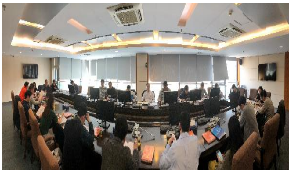
学校召开体育运动委员会会议

2、建立了体制较为健全的高水平运动队组织管理机构，由校长直接主管，负责学校体育工作的副校长进行分管，体育与健康学院具体负责教学训练、运动竞赛等工作，二级学院负责学生的日常专业文化学习、学校其他相关职能部门责权明确，协同对高水平运动队、运动员实施教育和科学管理。并初步制定了相关规章制度，为我校高水平运动队的发展提供有效组织保障。